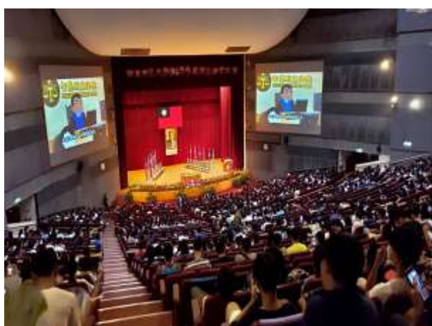
新生始業典禮宣導影片